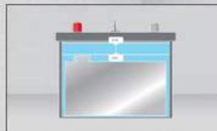
diseño con electrodos dispuestos más abajo y, por tanto, con mayor cabida para el ácido