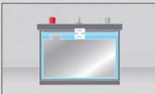
batería convencional con diseño tradicional